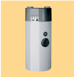
CETD 300 EH